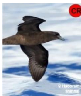
Pétrel noir de Bourbon Endémique

La SEOR prend chaque année en charge sur l'ensemble du territoire réunionnais plus de 3000 oiseaux en détresse . Le réseau de sauvetage et le centre de soins fonctionnent 7 jours sur 7.