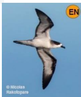
Pétrel de Barau Endémique